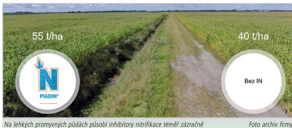
Na lehkých promyvných půdách působí inhibitory nitrifikace téměř zázračně