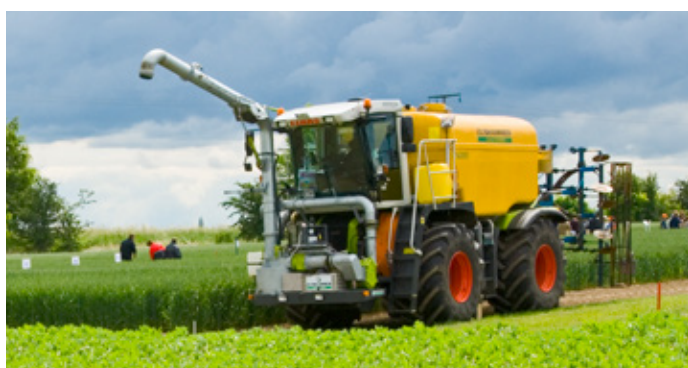
Dávkovač PIADINU® od společnosti agrotop GmbH.

proběhnou automaticky. Dávkovač si sám bude pomoci čerpadla a elektronického čítače průtoku odebírat přesné dávky přímo z přepravního obalu (sud 200 l, IBC 1 000 l). Dávkovač vám aplikaci PIADINU® ještě více usnadní a vždy si budete moci být jisti, že používáte optimální množství.